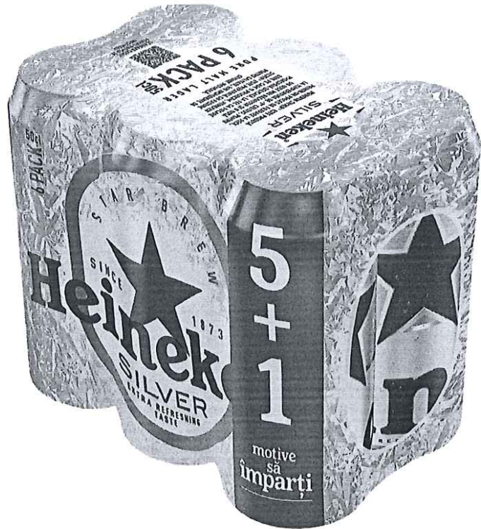
Pack doza 5+1 500 ml