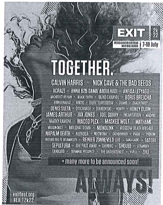
Experienta EXIT Festival