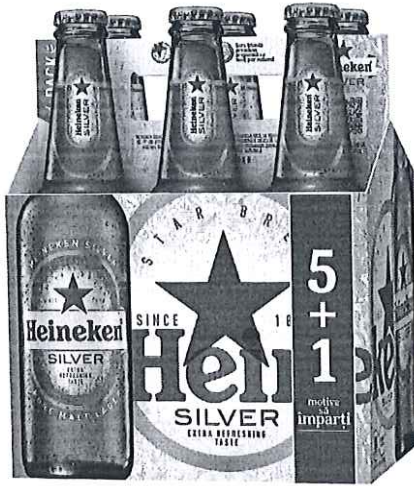
Pack sticla 5+1 330ml