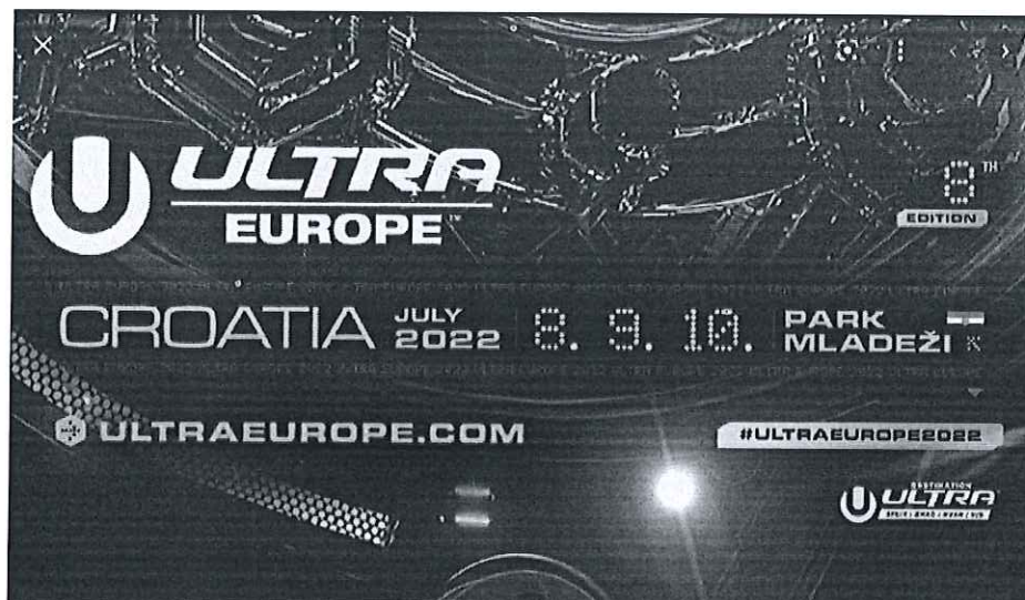
Experienta ULTRA Europe Festival

*Imaginile premiilor sunt cu titlu informativ