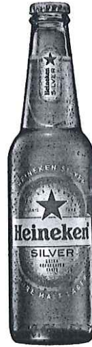
Sticla 330 ml