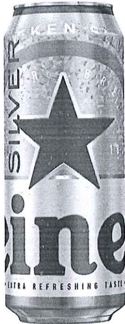
Doza 500 ml