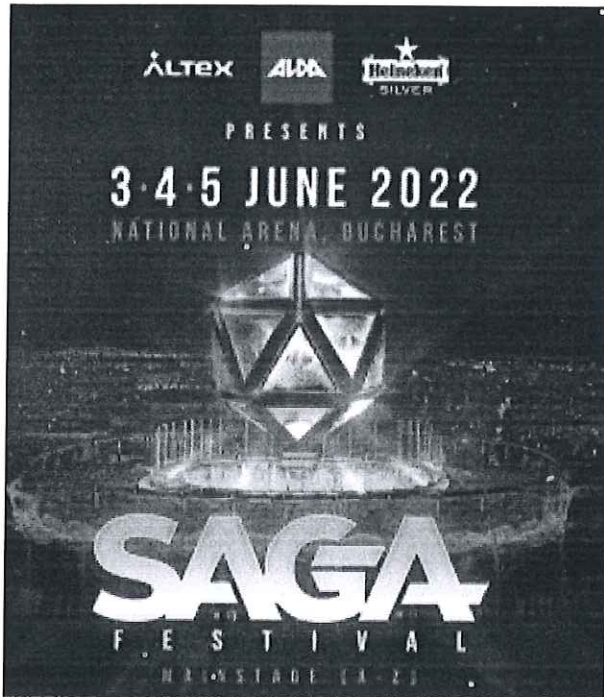
Experienta SAGA Festival